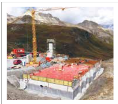
im Tiefbau - in den Bergen