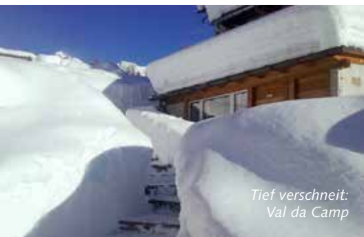
Tief verschneit: Val da Camp