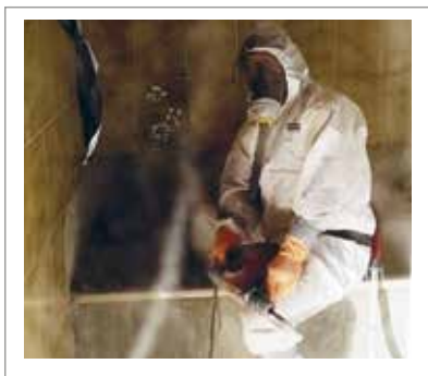
im Hochbau - bei Schadstoffsanierungen