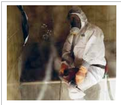
im Hochbau - bei Schadstoffsanierungen