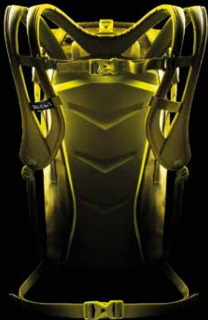
A P E X C L I M B

/ ENGINEERED IN THE HEART OF THE DOLOMITES