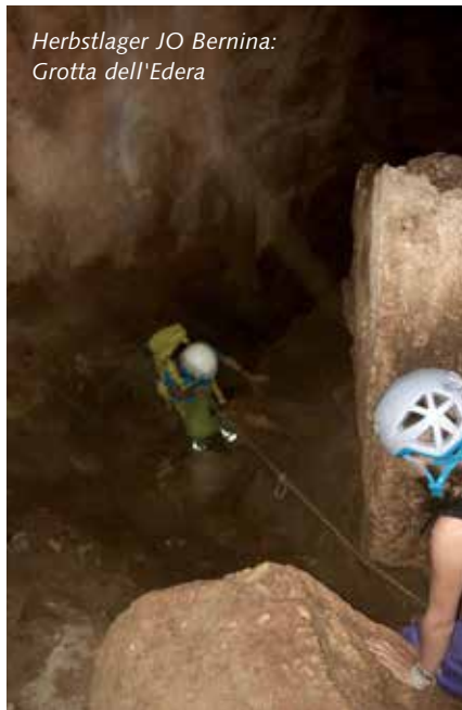
Herbstlager JO Bernina: Grotta dell'Edera

081 832 22 22 info@boom-sport.ch www.boomsport.ch