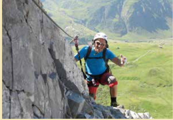
Impressionen Klettersteig Sulzfluh