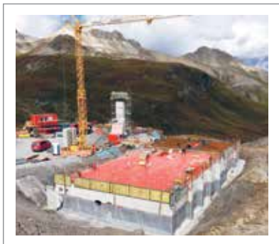
im Tiefbau - in den Bergen