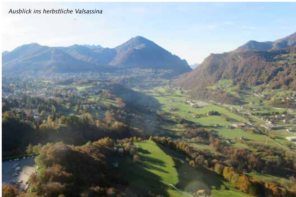
Ausblick ins herbstliche Valsassina