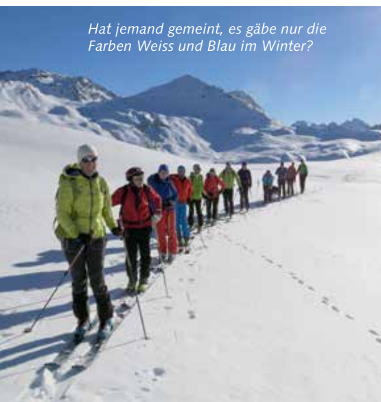
Hat jemand gemeint, es gäbe nur die Farben Weiss und Blau im Winter?

Der Rundblick auf dem Piz sucht seinesgleichen: Das Bergell präsentiert sich in der Falllinie zu unseren Füßen, der Silvaplannersee winkt mit seinem schwarzen Eis, die Lenzerheide liegt braun verträumt in der Ferne und der Piz Lunghin rundet vor unserer Nase das Panorama ab.