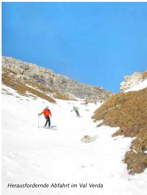
Herausfordernde Abfahrt im Val Verda