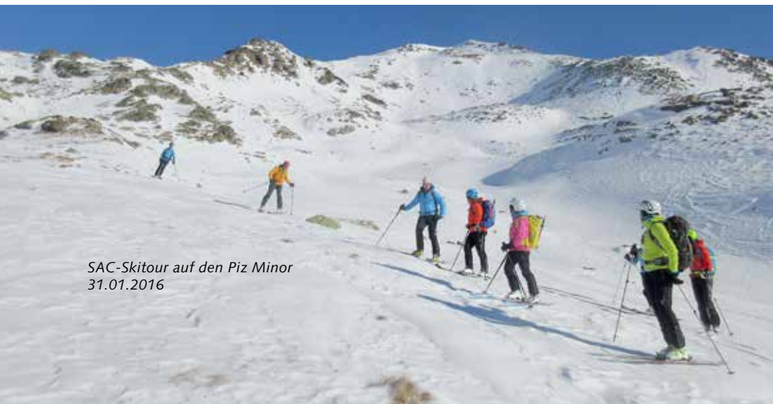
SAC-Skitour auf den Piz Minor 31.01.2016

Es wird dringendst empfohlen, bei Anfragen von Medien keine privaten Auskünfte zu erteilen. Unprofessionelle, unvollständige oder gar fehlerhafte Auskünfte können dem Beschuldigten, der Sektion oder dem Verband erheblichen Schaden zufügen. Insbesondere können falsche Auskünfte zwischen dem Schädiger und der Auskunftsperson rechtlich von