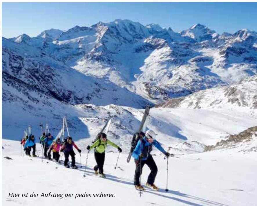
Hier ist der Aufstieg per pedes sicherer.

Täglich geöffnet: Unser Internet-Shop auf www.cafe-badilatti.ch