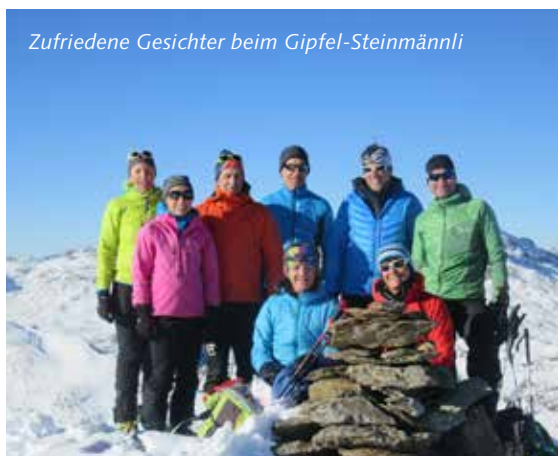
Zufriedene Gesichter beim Gipfel-Steinmännli