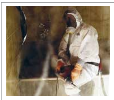
im Hochbau - bei Schadstoffsanierungen