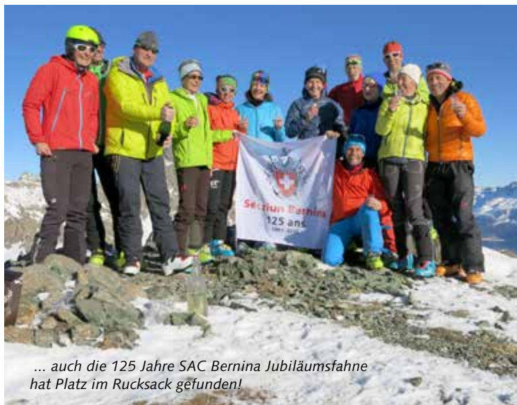
... auch die 125 Jahre SAC Bernina Jubiläumsfahne hat Platz im Rucksack gefunden!