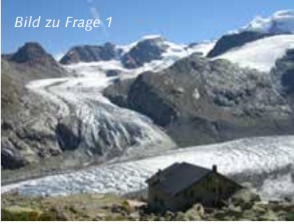
Bild zu Frage 1