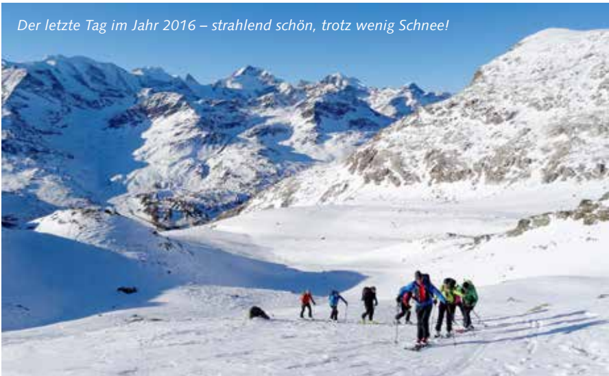
Der letzte Tag im Jahr 2016 – strahlend schön, trotz wenig Schnee!