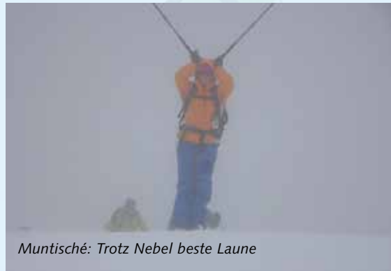
Muntisché: Trotz Nebel beste Laune