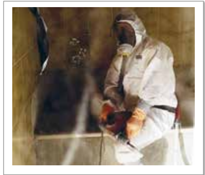
im Hochbau - bei Schadstoffsanierungen