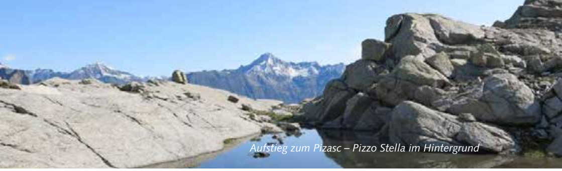
Aufstieg zum Pizasc – Pizzo Stella im Hintergrund