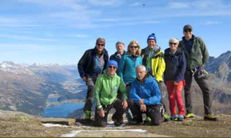
«Wunderschöne Tour mit Blick zur Oberengadiner Seelandschaft und eine geniale Rundsicht. Wetter und Team genial. Bis zum nächsten Anlass.» TL-Chef Ezio