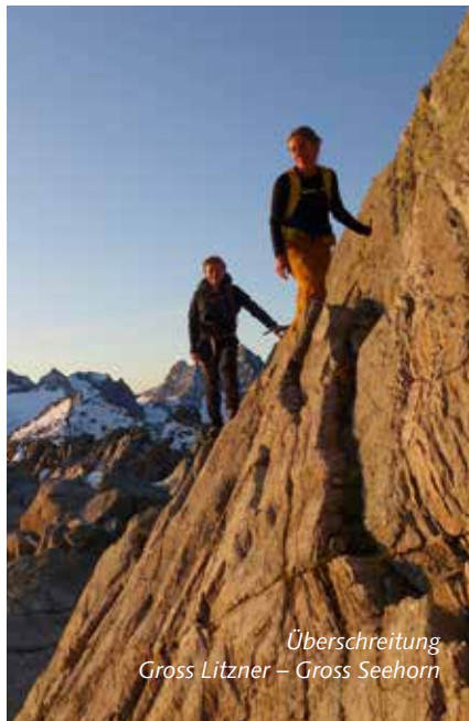
Überschreitung Gross Litzner – Gross Seehorn

Boom Sport - Galerie Bad - Via Tegjatscha 5 7500 St. Moritz-Bad Tel. 081 832 22 22 - info@boom-sport.ch