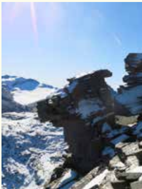
Blick Richtung Piz Fora