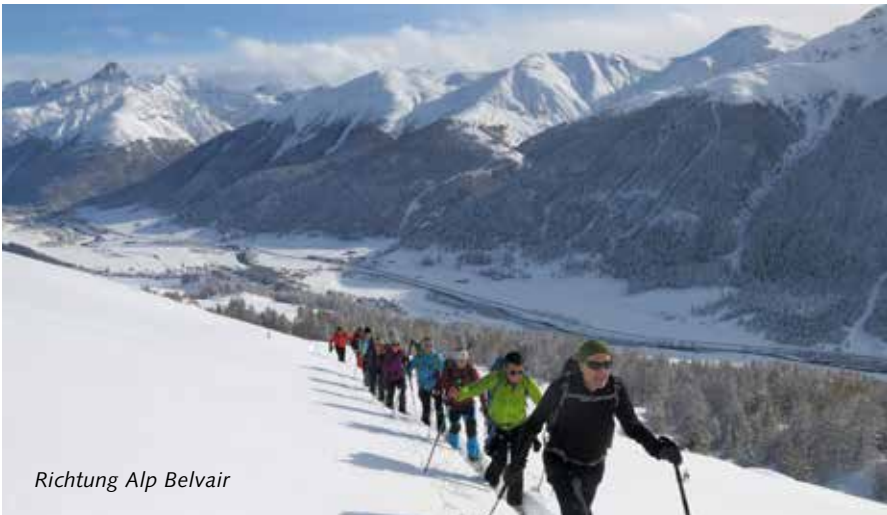
Richtung Alp Belvair