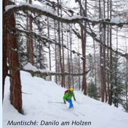
Muntisché: Danilo am Holzen