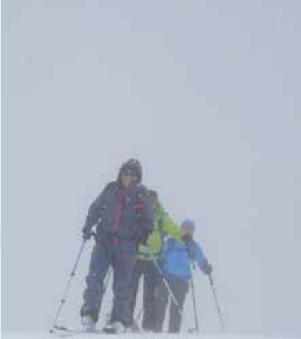
Muntisché: Gipfel bald erreicht