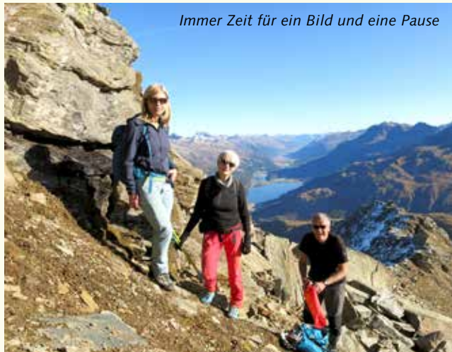
Immer Zeit für ein Bild und eine Pause