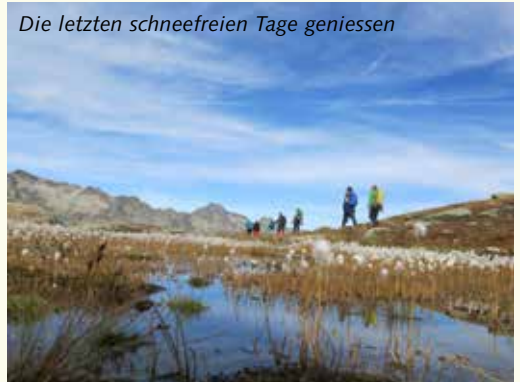
Die letzten schneefreien Tage genießen