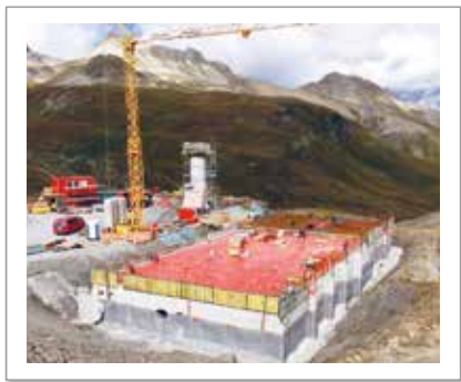
im Tiefbau - in den Bergen