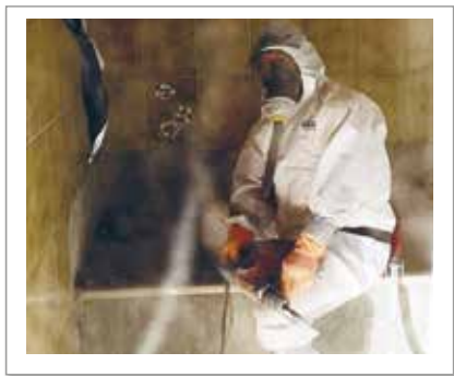
im Hochbau - bei Schadstoffsanierungen