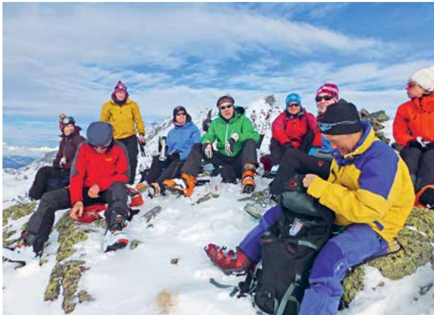
Gipfelrast auf dem Piz Campagnung Sur, auch Piz Pelle genannt, 3001 m ü. M.

info@fh-architektur.ch www.fh-architektur.ch