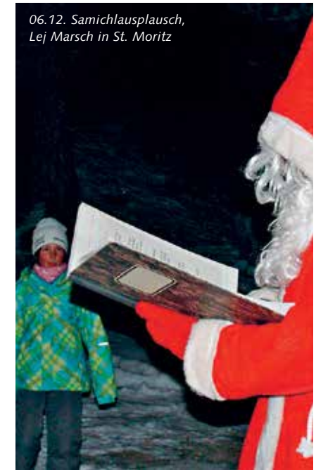
06.12. Samichlausplausch, Lej Marsch in St. Moritz