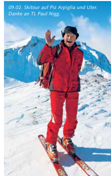
09.02. Skitour auf Piz Arpiglia und Uter. Danke an TL Paul Nigg.