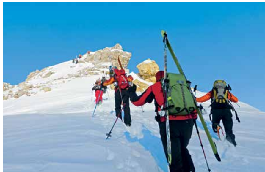
Die letzten paar Meter stampfen sie zum Corn Suvretta – 3072 m ü. M.

nehend zu überwinden gewillt waren. Nicht weniger als 32 Ohren lauschen der Ansprache des Tourenchefs, und nicht wenige hoffen, dass dieser sich kurz halten möge. Nicht, dass dessen Ansprachen für Langatmigkeit bekannt wären; oh nein, sie haben mit dem vorliegenden Gefasel, durch das sich die werte Leserschaft mühselig kämpft, nicht das Geringste gemeinsam. Aber es handelt sich wie erwähnt um einen ebenso klaren wie kalten Morgen, der alle nach Bewegung lechzen lässt. Beim gemütlichen Trott durch die Valletta da Gügli huldigen wir alle dem zweiten Hauptsatz der Thermodynamik (keine Energieumwandlung ohne Abwärme!), dank dem wir unsere Körper langsam auf angenehme Betriebstemperatur bringen können. Unter den 16 mich umgebenden Gesichtern hat es viele mir unbekannte. Ob der SAC Ber-