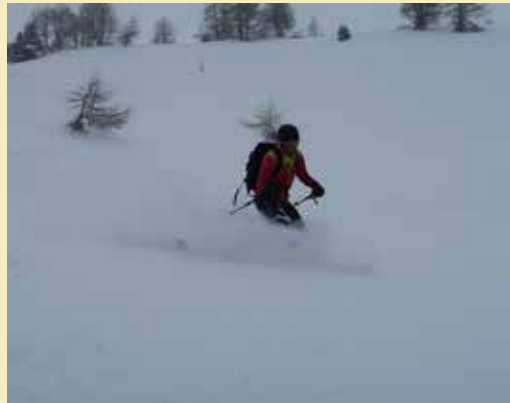
Herrlicher Neuschnee auf der Abfahrt