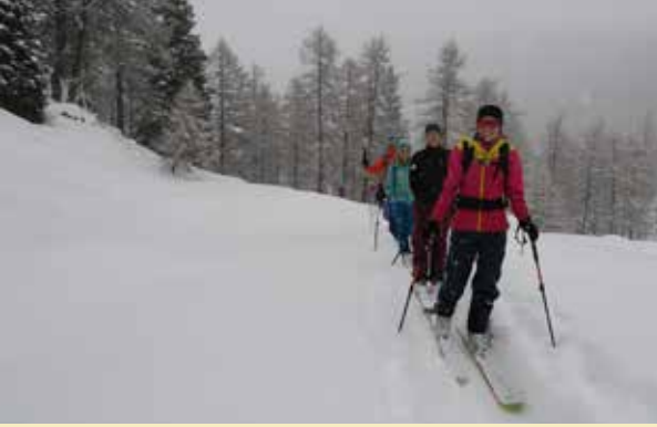
Mitten im Winterwunderland