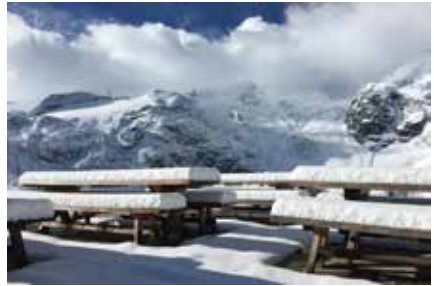
Früher Wintereinbruch auf der Chamanna Boval

Wenn alles nach Plan verläuft, freuen wir uns, Ende März 2021 in die Skitourensaison zu starten.