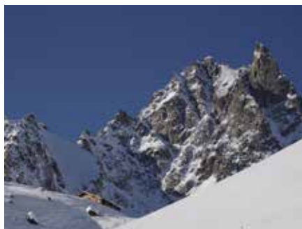
Die Chamanna d'Escha präsentiert sich von ihrer schönsten Seite.

Wir von der Hüttenkommission sind auf gute oder sehr gute Ergebnisse angewiesen. Denn die nächsten Investitionen stehen an und für die Umsetzung braucht's wie immer zwangsläufig Geld. Nach wie vor ist es für die Hüttenkommission eine grosse Herausforderung den wachsenden technischen Ansprüchen auf unseren Hütten gerecht zu werden.