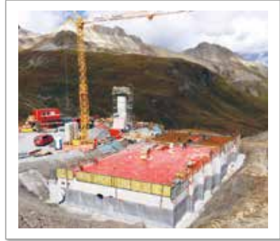
im Tiefbau - in den Bergen