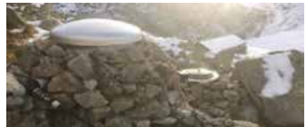
Sanierung Wasserfassung und Reservoir