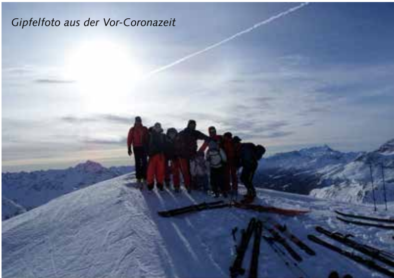
Gipelfoto aus der Vor-Coronazeit